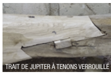
TRAIT DE JUPITER À TENONS VERROUILLÉ