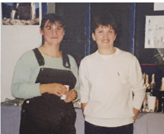
Inauguration de l'épicerie... il y a 23 ans!

Mais quelque soit la saison, on trouve pratiquement tout à l'épicerie, y compris des informations sur la vie du village. C'est vraiment un lieu de rencontres et d'échanges indispensable à la vie du village. L'épicerie, ce n'est pas que du commerce, c'est aussi de l'humain. Pouvez-vous imaginer Rigny-Ussé sans son épicerie ?