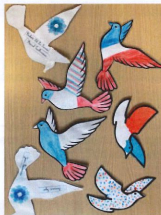
Colombes de la paix aux couleurs du drapeau faites par les enfants

12h15 : pot de l'amitié à St Benoît la Forêt